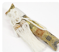
懐剣(お守り付きもあり)